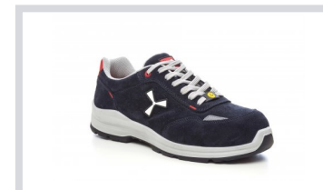
S0301 NÁMOŘNICKÁ MODRÁ