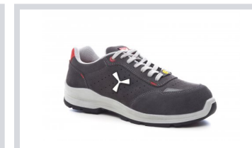
S1005 OCELOVĚ ŠEDÁ